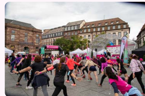
Animation sur le village Place Kléber