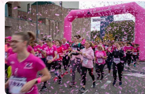
Départ Route de Vienne

Gratuit et sans inscription pour les - de 15 ans accompagnés d'un adulte