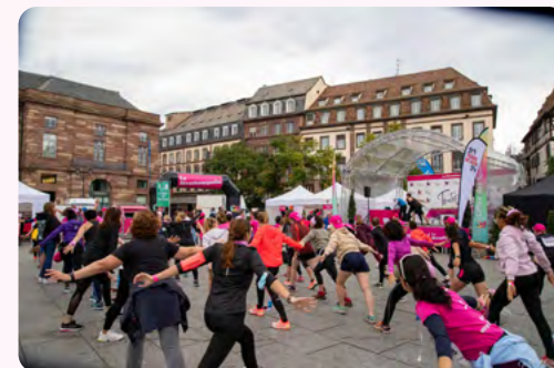
Animation sur le village Place Kléber