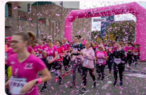
Départ Route de Vienne

Gratuit et sans inscription pour les - de 14 ans accompagnés d'un adulte